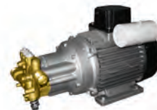
MTP KTR Gold