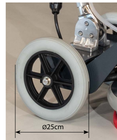
Excellente stabilité et accessibilité dans les escaliers.