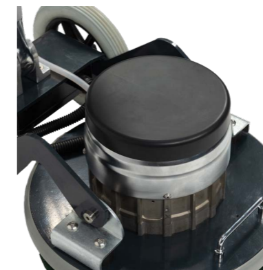
Le capot de protection protège le moteur de l'humidité.