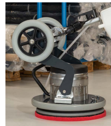
Timon inclinable pour augmenter la pression de contact.