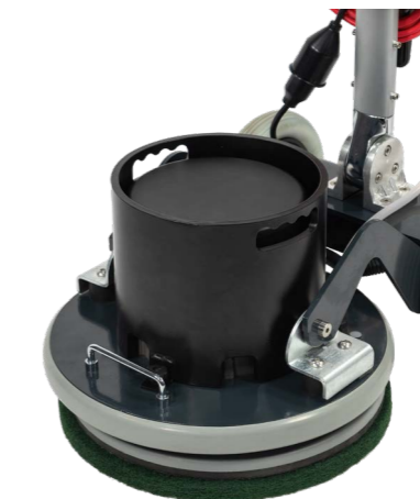
Poids supplémentaire en option, 12 kg. N° article 207.119