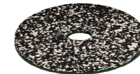
Power Pad pour toutes les surfaces. N° article 201.076