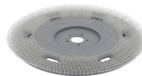
Brosse moyenne. N° article 207.115

Pads pour disques pour toutes les surfaces avec différents degrés de dureté.